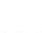
Haus A OG1