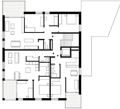
Haus C OG1