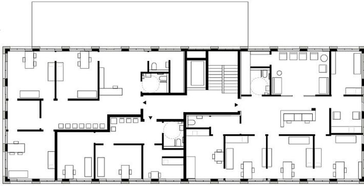
Quartier an der Schillerallee