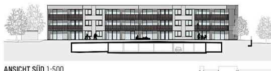
ANSICHT SÜD 1:500