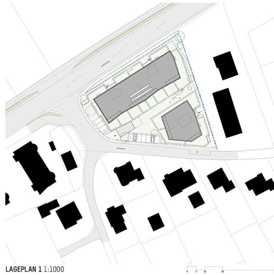
LAGEPLAN 1 1:1000