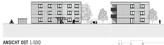
ANSICHT OST 1:500