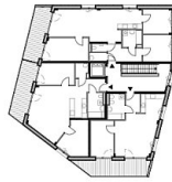
OBERGESCHOSS 2 1:500