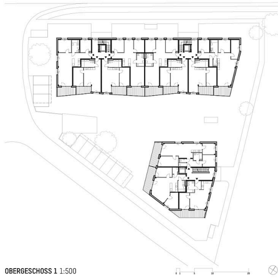
OBERGESCHOSS 1 1:500