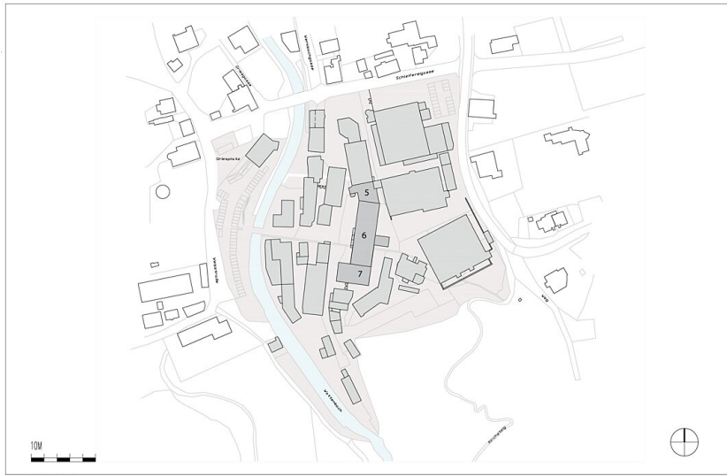
Werkstätte Walters Gebäude 5/6 Lageplan