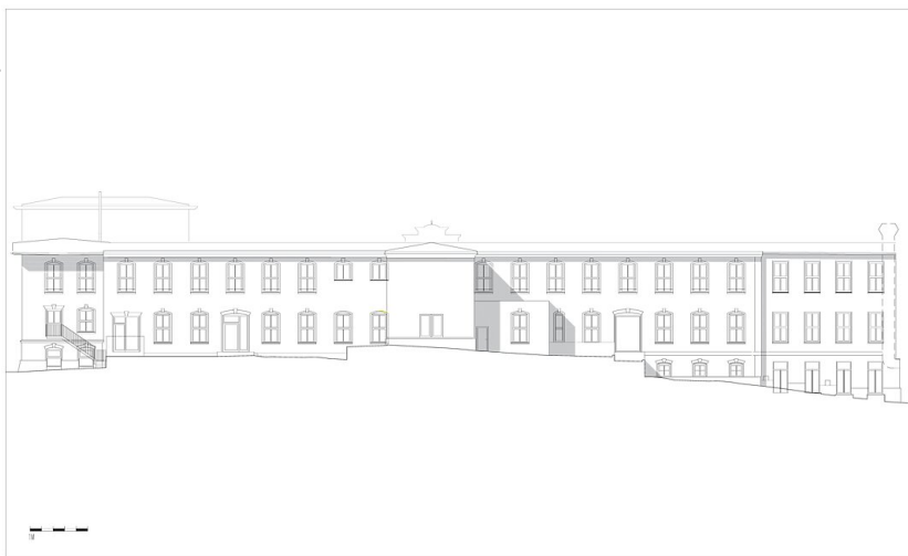
Werkstätte Waltens 2. Bauabschnitt - Gebäude 5/6 Ansicht Ost