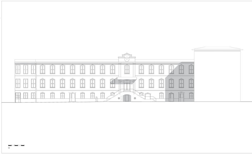
Werkstätte Waltens 2. Bauabschnitt - Gebäude 5/6 Ansicht West