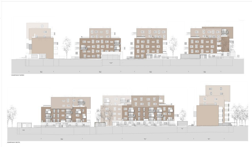
Ansicht West Nord