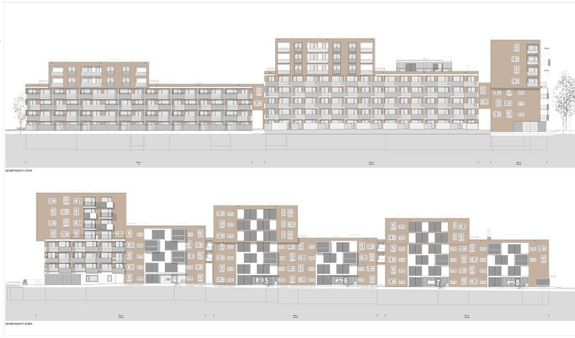
Wohnquartier Mühlbach Ost