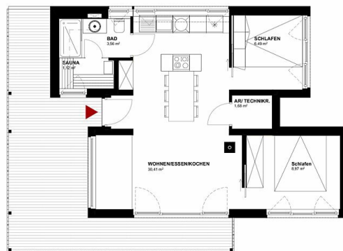
Grundriss Rosa und Margarete