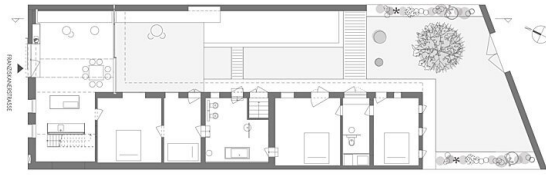
erdgeschoss M 1:100